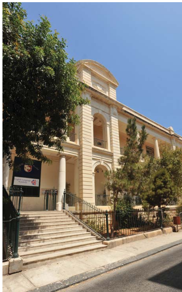
Летняя резиденция для подростков

С этого года ELA проводит онлайн обучение, которое позволяет пройти курсы, существующие в нашей школе. Эти курсы для тех, кто работает/учится и не может находиться в Академии лично. За дополнительной информацией обращайтесь в наш офис.